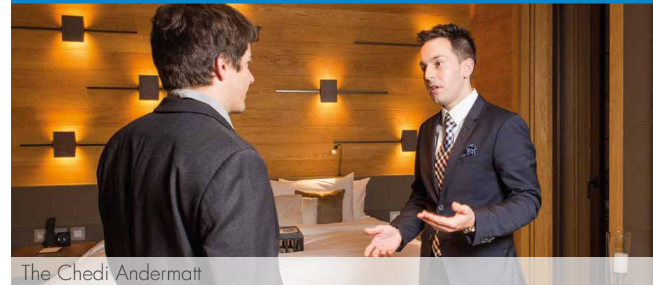
The Chedi Andermatt

«Dank der Höheren Berufsbildung bin ich heute im Management tätig und kann im Ausland wertvolle Erfahrungen sammeln.»